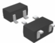
RT9198-15GY Richtek USA Inc. IC REG LDO 1.5V 0.3A SC82