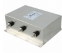
10TDS6D Delta Electronics LINE FILTER 440VAC 10A CHASS MNT