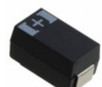
10THB330M Panasonic Electronic Components CAP TANT POLY 330UF 10V 2917