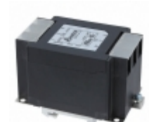
10TDPS6(D) Delta Electronics LINE FILTER 10A DIN RAIL