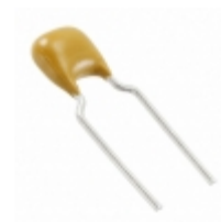
C321C183J3G5TA KEMET CAP CER RAD 18NF 25V COG 5%