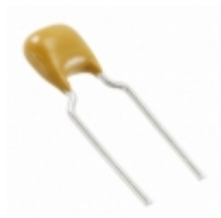
C321C183J2G5TA KEMET CAP CER RAD 18NF 200V COG 5%