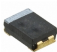
CWR09NC104KB AVX Corporation CAP TANT 0.1UF 10% 50V 1005