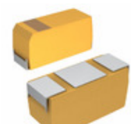
CWR09MC475KB KEMET CAP TANT 4.7UF 10% 35V 2711