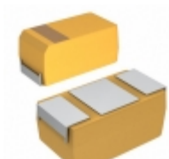
CWR09MC685KB KEMET CAP TANT 6.8UF 10% 35V 2915