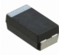
CWR09MC685KB AVX Corporation CAP TANT 6.8UF 10% 35V 2915