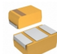
CWR09MC335KB KEMET CAP TANT 3.3UF 10% 35V 2214