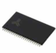
AS6C4016A-55ZIN Alliance Memory, Inc. IC SRAM 4MBIT 55NS 44TSOP