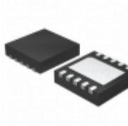
MCP4632T-503E/MF Microchip Technology IC DGTL POT 50K 129TAPS 10-DFN