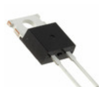
DPG15I300PA IXYS DIODE GEN PURP 300V 15A TO220AC