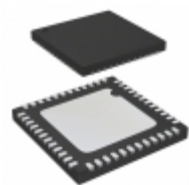
SI4688-A10-GMR Silicon Labs IC RADIO RX ANLG/DGTL 48QFN