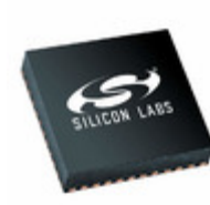
SI4689-A10-GM Energy Micro (Silicon Labs) IC ANLG/DGTL RADIO 48QFN