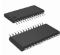
AT97SC3204-U1A190 Microchip Technology IC CRYPTO TPM LPC 28TSSOP