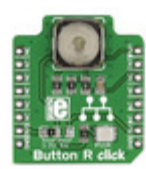
MIKROE-1901 MikroElektronika BOARD BUTTON R CLICK