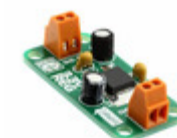
MIKROE-191 MikroElektronika BOARD VREG 3.3V MC33269DT 3.3