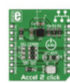
MIKROE-1905 MikroElektronika DEV BOARD ACCEL2 CLICK