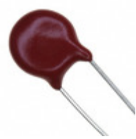
V18ZC1 Littelfuse Inc. VARISTOR 18V 250A DISC 7MM