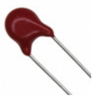
V18ZC05P Littelfuse Inc. VARISTOR 18V 100A DISC 5MM