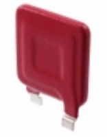
V181HB34 Littelfuse Inc. VARISTOR 282V 40KA SQUARE 34MM