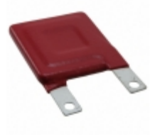
V181HF34 Littelfuse Inc. VARISTOR 282V 40KA SQUARE 34MM