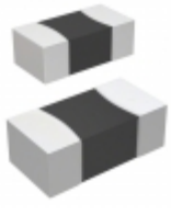
V18AUMLA1206NA Littelfuse Inc. VARISTOR 27.5V 1206