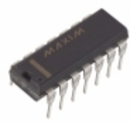
MAX512CPD+ Maxim Integrated IC DAC TRPL VOLT-OUT 8BIT 14-DIP