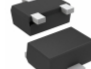
DTA143ZEBHZGTL LAPIS Semiconductor PNP DIGITAL TRANSISTOR (WITH BUI