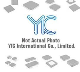
DTA143ZE ROHM DTA143ZE ROHM