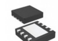
MCP2558FDT-H/MF Microchip Technology IC TXRX CAN FD 8MBPS 8DFN