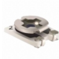
TC42X-2-684E Bourns, Inc. TRIMMER 680K OHM 0.1W J LEAD TOP