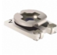
TC42X-2-683E Bourns, Inc. TRIMMER 68K OHM 0.1W J LEAD TOP