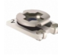
TC42X-2-682E Bourns, Inc. TRIMMER 6.8K OHM 0.1W J LEAD TOP