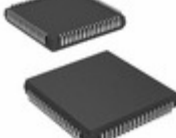
ISPLSI 1024-90LJ Lattice Semiconductor Corporation IC CPLD 64MC 12NS 68PLCC