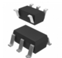
SC189BSKTRT Semtech Corporation IC REG BUCK 1.1V 1.5A SYNC SOT23