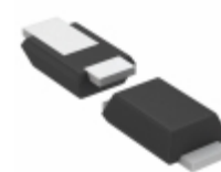
TFZVTR39B Rohm Semiconductor ZENER DIODE