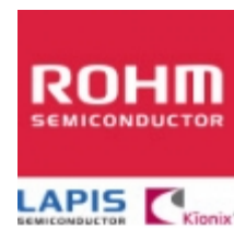
MTZJT-725.6B/5.6V ROHM MTZJT-725.6B/5.6V ROHM