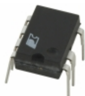
TNY274PG Power Integrations IC OFFLINE SWIT OVP OTP HV 8DIP