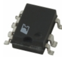
TNY274GN Power Integrations IC OFFLINE SWIT OVP OTP HV 8SMD