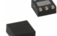
MIC5320-JJYMT-TR Microchip Technology IC REG LDO 2.5V 0.15A 6TMLF