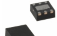
MIC5320-KDYMT-TR Microchip Technology IC REG LDO 2.6V/1.85V 6TMLF