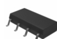
AQW214S Panasonic RELAY OPTO DPST-NO 80MA 400V