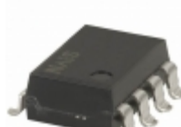
AQW214HLA Panasonic RELAY OPTO DPST W/RESIST 8 SMD