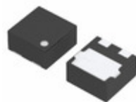
XC6120C262HR-G Torex Semiconductor Ltd IC SUPERVISOR 2.6V 3-USP