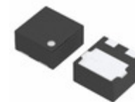
XC6120C292HR-G Torex Semiconductor Ltd IC SUPERVISOR 2.9V 3-USP