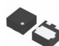
XC6120C252HR-G Torex Semiconductor Ltd IC SUPERVISOR 2.5V 3-USP