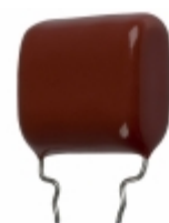
ECQ-P1H274GZW Panasonic Electronic Components CAP FILM 0.27UF 2% 50VDC RADIAL