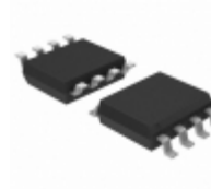
MIC5239-3.15BM Microchip Technology IC REG LDO 3.15V 0.5A 8SOIC