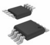
MIC5239-3.15BMM Microchip Technology IC REG LDO 3.15V 0.5A 8MSOP