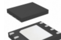
SST25VF020B-80-4I-QAE-T Microchip Technology IC FLASH 2MBIT 80MHZ 8WSON