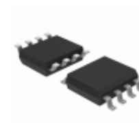
ATTINY402-SSNR Micrel / Microchip Technology 20MHZ, 4KB, SOIC8, IND 105C, GRE