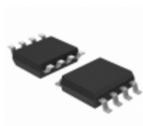
ATTINY402-SSFR Micrel / Microchip Technology 20MHZ, 4KB, SOIC8, IND 125C, GRE