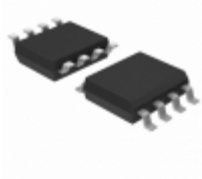
ATTINY412-SSFR Micrel / Microchip Technology 20MHZ, 4KB, SOIC8, IND 125C, GRE