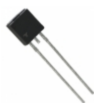
P0900ECRP2 Hamlin / Littelfuse SIDACTOR BI 75V 400A TO-92