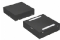
P0900Q12BLRP Hamlin / Littelfuse SIDACTOR BI 75V 250A 2QFN