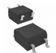
CPC1125N IXYS Integrated Circuits Division RELAY SSR SPST-NC 100MA 4-SOP