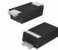
CDZT2RA6.2B Rohm Semiconductor DIODE ZENER 6.2V 100MW VMN2