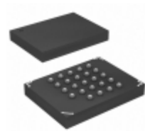
AT45DB161B-CI Microchip Technology IC FLASH 16MBIT 20MHZ 24CBGA