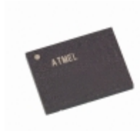
AT45DB161B-CNC-2.5 Microchip Technology IC FLASH 16MBIT 15MHZ 8CASON