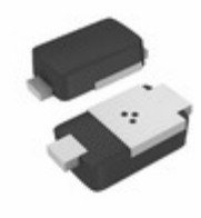
SE20PAJ-M3/I Electro-Films (EFI) / Vishay DIODE GEN PURP 600V 1.6A DO220AA