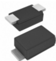
SE20FJHM3/I Vishay Semiconductor Diodes Division DIODE GEN PURP 600V 1.7A DO219AB