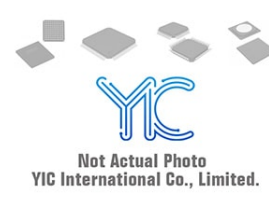
P3500SA-L Littelfuse P3500SA-L Littelfuse