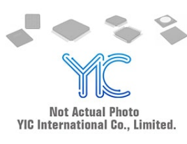
P3500SAL LITTELF P3500SAL LITTELF