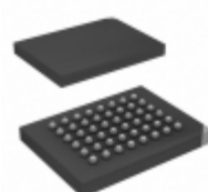
SST38VF6403-90-5C-B3KE Microchip Technology IC FLASH 64MBIT 90NS 48TFBGA