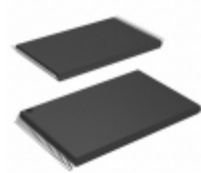
SST38VF6402-90-5I-EKE Microchip Technology IC FLASH 64MBIT 90NS 48TSOP