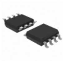
MIC29201-3.3YM Microchip Technology IC REG LDO 3.3V 0.4A 8SOIC