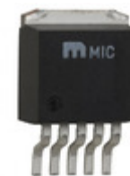
MIC29201-3.3WU Microchip Technology IC REG LDO 3.3V 0.4A TO263-5