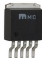
MIC29201-3.3WU-TR Microchip Technology IC REG LDO 3.3V 0.4A TO263-5