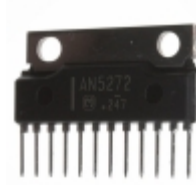
AN5274 Panasonic Electronic Components IC AUDIO AMP 2CH 4W SIL-12 W/FIN