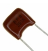
ECQ-B1H391KF Panasonic Electronic Components CAP FILM 390PF 10% 50VDC RADIAL