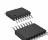
LTC2376CMS-20#PBF Linear Technology IC ADC 20BIT 250KSPS 16MSOP