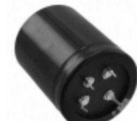
ECE-T2WA561FA Panasonic Electronic Components CAP ALUM 560UF 20% 450V SNAP