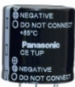
ECE-T2WP471FA Panasonic Electronic Components CAP ALUM 470UF 20% 450V SNAP