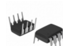
24LC64F-I/P Microchip Technology IC EEPROM 64KBIT 400KHZ 8DIP