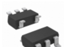
24LC64FT-I/OT Microchip Technology IC EEPROM 64KBIT 400KHZ SOT23-5