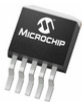
MCP1827-0802E/ET Microchip Technology IC REG LDO 0.8V 1.5A DDPAK