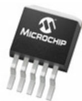
MCP1827-1202E/ET Microchip Technology IC REG LDO 1.2V 1.5A DDPAK