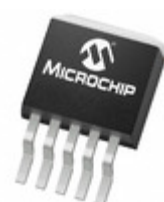
MCP1826T-ADJE/ET Microchip Technology IC REG LDO ADJ 1A DDPAK