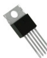
MCP1827-1802E/AT Microchip Technology IC REG LDO 1.8V 1.5A TO220-5