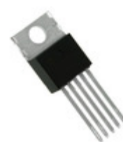
MCP1827-2502E/AT Microchip Technology IC REG LDO 2.5V 1.5A TO220-5