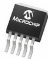
MCP1827-1802E/ET Microchip Technology IC REG LDO 1.8V 1.5A DDPAK