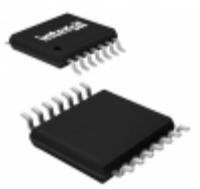
X40435V14-B Intersil IC VOLT MON TRPL EEPROM 14-TSSOP