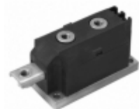
VSKT170-14 Electro-Films (EFI) / Vishay SCR DBL HISCR 1400V 170A MAGNPAK