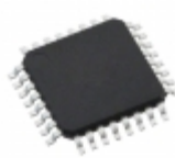
AT17LV010A-10QC Microchip Technology IC CONFIG SEEPROM 1M 3.3V 32TQFP