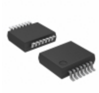
74LVC126ADB,118 Nexperia USA Inc. IC BUFF DVR TRI-ST QD 14SSOP