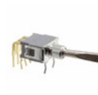
ATE2N-5F3-10-Z Copal Electronics Inc. SWITCH TOGGLE DPDT 50MA 48V