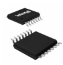
X40431V14-BT1 Intersil IC VOLT MON TRPL EEPROM 14-TSSOP