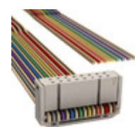
M1BXA-1640K 3M IDC CABLE - MSR16A/MC16F/X