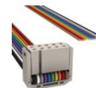
M1BXA-1036R 3M IDC CABLE - MSR10A/MC10M/X