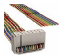
M1BXA-1440K 3M IDC CABLE - MSR14A/MC14F/X