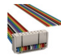
M1BXA-1636R 3M IDC CABLE - MSR16A/MC16M/X