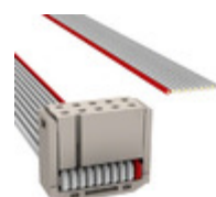
M1BXA-1036J 3M IDC CABLE - MSR10A/MC10G/X