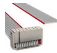
M1BXA-1436J 3M IDC CABLE - MSR14A/MC14G/X