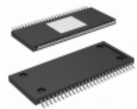
BM5446EFV-E2 Rohm Semiconductor IC AMP SPEAKER W/DSP HTSSOP-B54