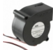
BM5125-04W-B50-L00 NMB Technologies Corp. FAN BLOWER 51X25MM 12VDC WIRE